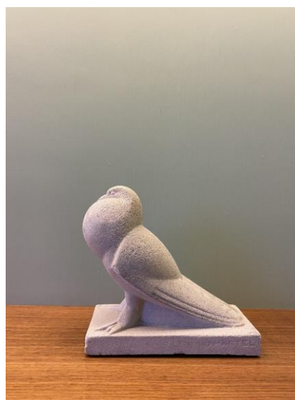
Pigeon à queue plate, 1925, sculpture en pierre reconstituée, 27 x 27 x 13,5 cm, Jan et Joël Martel