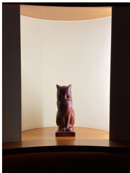
Chat assis, 1925, sculpture en terre cuite, H 34 cm, Jan et Joël Martel, © Aurore Danneels/Centre des monuments nationaux